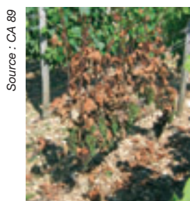
figure 2 : Esca/BDA apoplexie