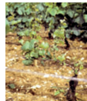
figure 3 : Eutypiose